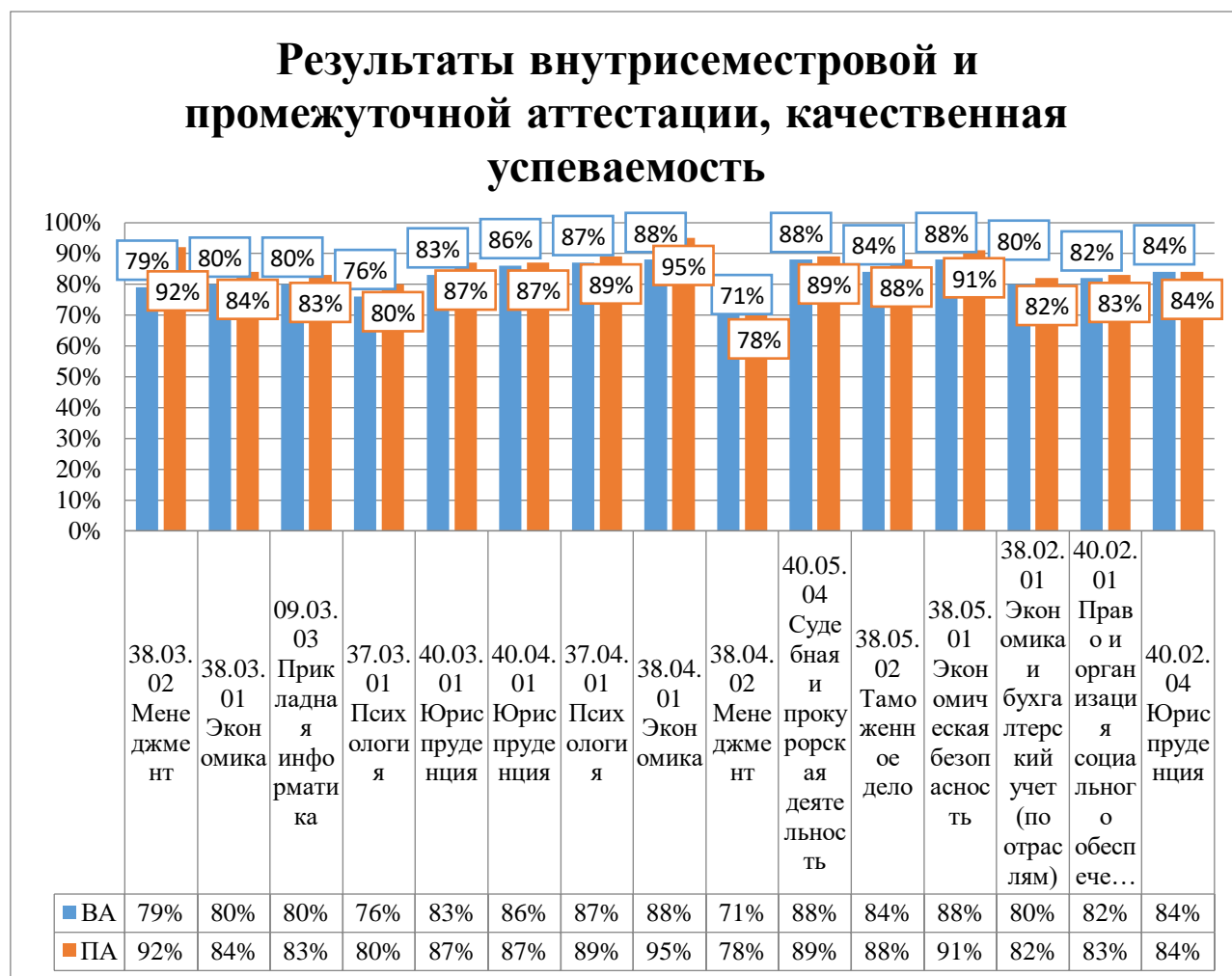
Рис 4. Результаты внутрисеместровой и промежуточной аттестации 2024-2025 учебный год, качественная успеваемость, %

3. Важной формой в подготовке и становлении специалиста является практическая подготовка, которая организуется при проведении практики. В процессе прохождения практики обучающимся прививаются умения и навыки в решении широкого спектра вопросов в сфере своей будущей профессиональной деятельности, что позволяет обеспечить их высокую конкурентоспособность на рынке труда и успешную профессиональную деятельность.