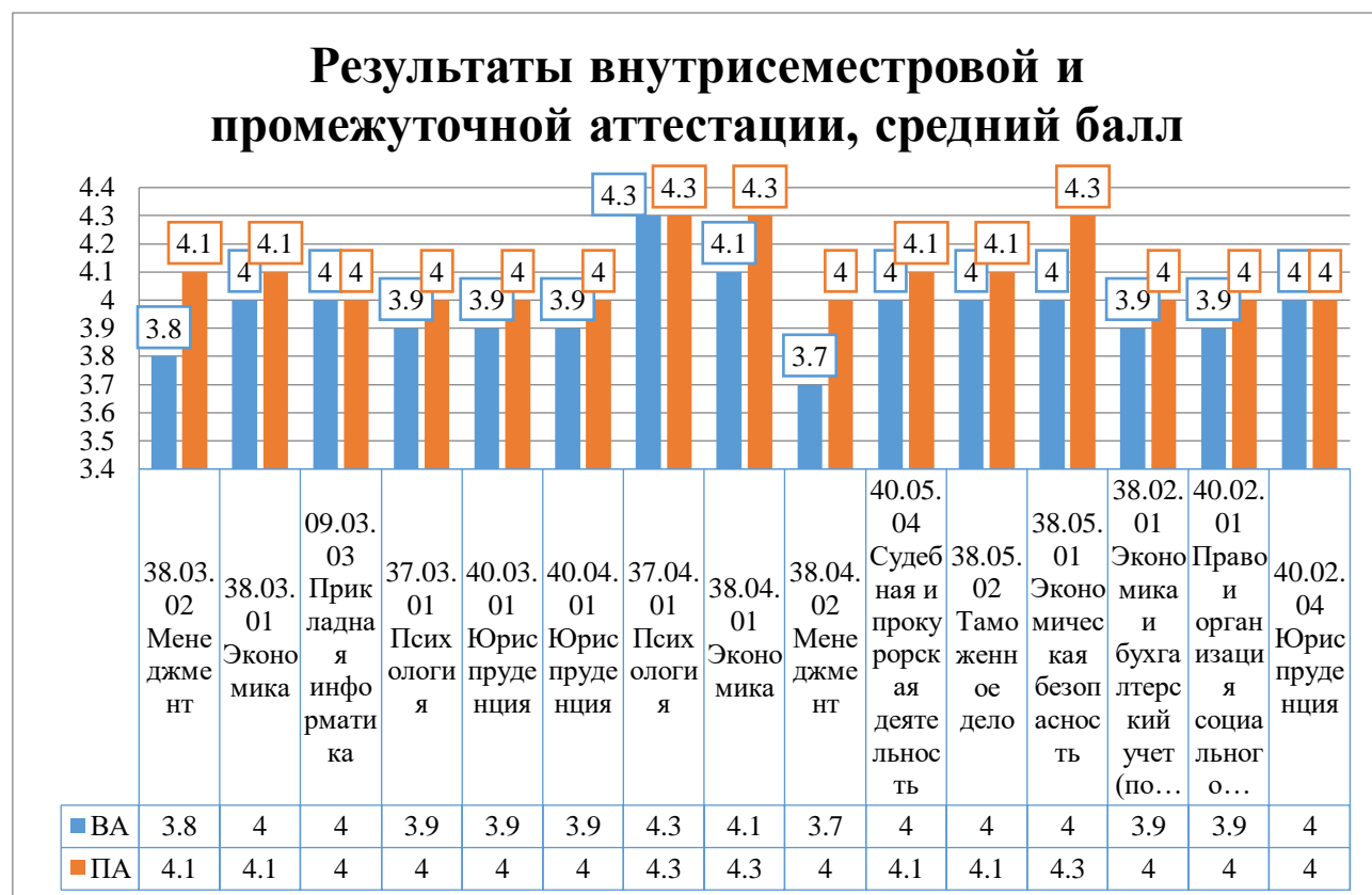
Рис 2. Результаты внутрисеместровой и промежуточной аттестации 2024-2025 учебный год, средний балл

89%) у обучающихся по направлениям подготовки 38.04.01 Экономика, 38.05.01 Экономическая безопасность, 37.04.01 Психология.