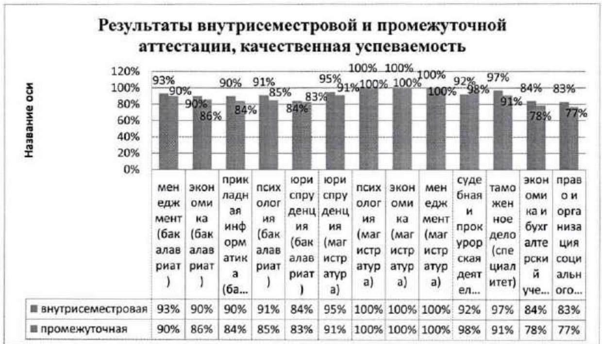
Рис 4. Результаты внутрисеместровой и промежуточной аттестации 2022-2023 учебный год, качественная успеваемость, %

3. Важной формой в подготовке и становлении специалиста является практическая подготовка, которая организуется при проведении практики. В процессе прохождения практики обучающимся прививаются умения и навыки в решении широкого спектра вопросов в сфере своей будущей профессиональной деятельности, что позволяет обеспечить их высокую конкурентоспособность на рынке труда и успешную профессиональную деятельность.