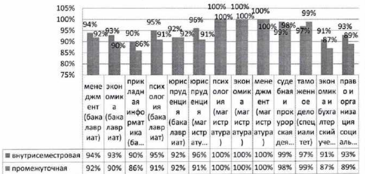
Рис 3. Результаты внутрисеместровой и промежуточной аттестации 2022-2023 учебный год, абсолютная успеваемость, %